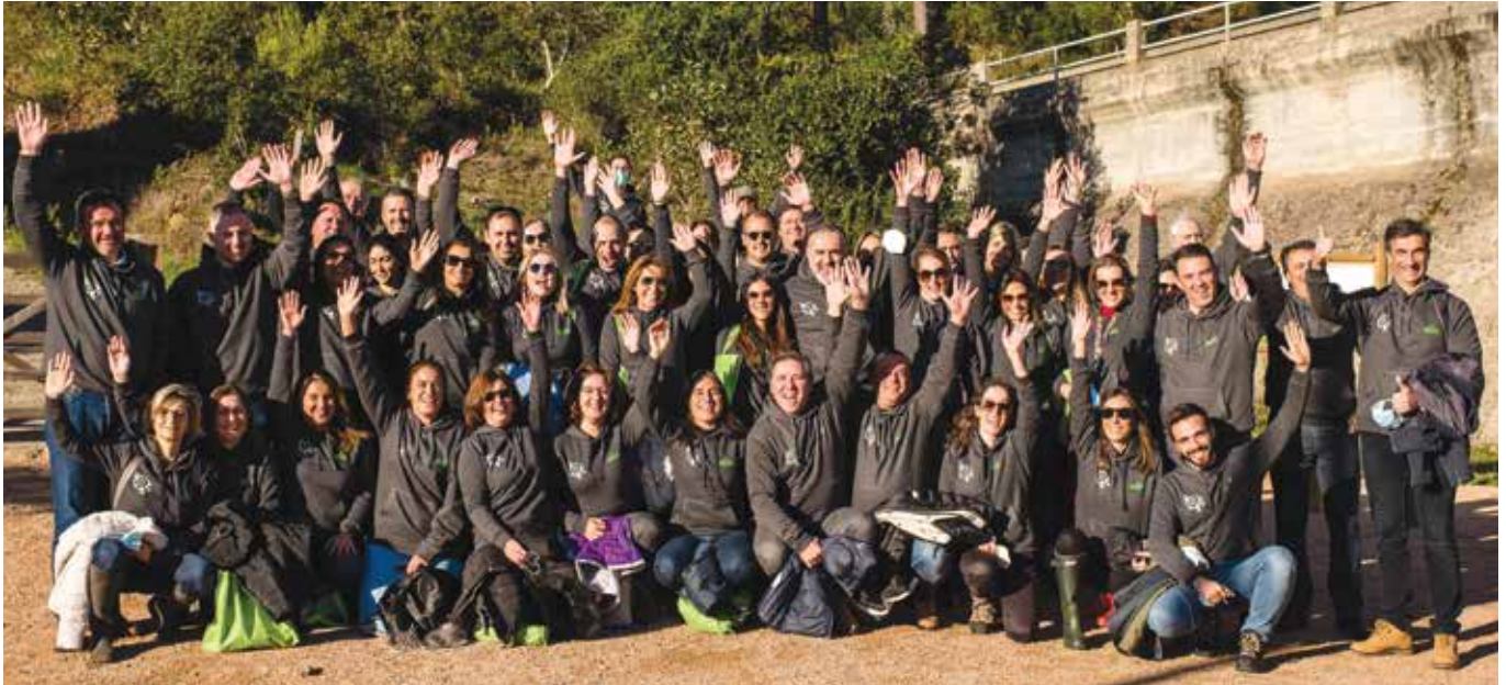
Equipa da Grünenthal Portugal

Os sucessivos confinamentos e as restrições a que a pandemia obrigou resultaram num impacto muito acentuado no acompanhamento das doenças não-covid e a dor crónica não foi exceção. Este facto é particularmente preocupante quando sabemos que a dor é uma das principais razões que leva as pessoas a procurar cuidados médicos.