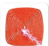
DOR® Choque elétrico