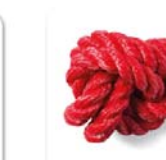
DOR® Espasmo agudo