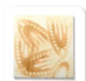
DOR® Ferro em brasa