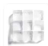
DOR® Frio gelado