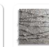
DOR® Arame farpado