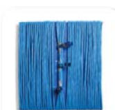
DOR® Beliscão no nervo